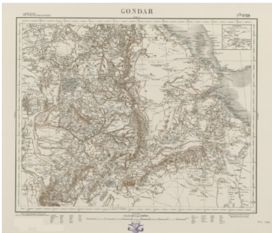
Carte de l'Afrique à l'échelle du 2 000 000e. Feuille 29 : Gondar [Ethiopie]